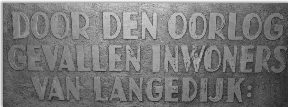
Tekst op het oude monument, met oude spelling

"Door de oorlog gevallen inwoners van Langedijk" , dan is overduidelijk dat zijn overlijden is veroorzaakt "door de oorlog" . Om die reden wordt ook hij herdacht.