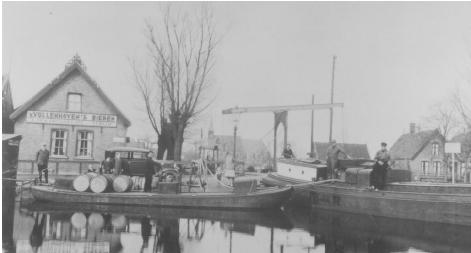
Rechts ligt het schip De tijd zal 't leeren van Dirk Hoogland, de foto is genomen bij de oude sluis in Broek op Langedijk